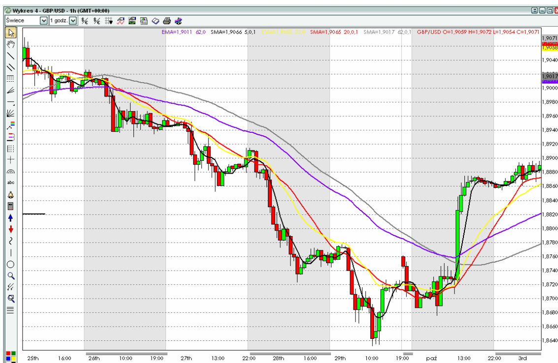
Ponad 400 pipsów w pięć dni handlowych – koniec września 2006 r.