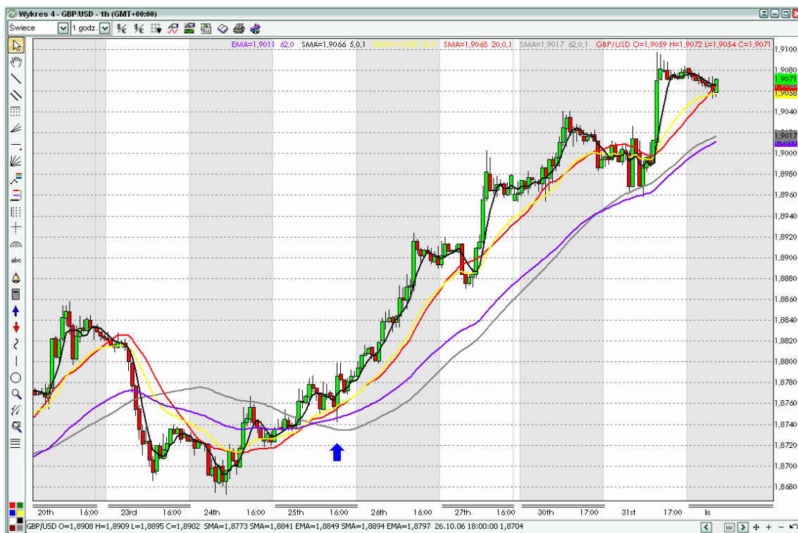
Ponad 400 pipsów w sześć dni handlowych – koniec października 2006 r.